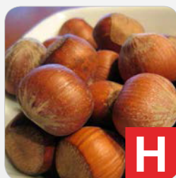
Schalenfrüchte z.B. Mandeln, Haselnüsse, Wal- nüsse wie in Brot, Gebäck, Desserts, Süßigkeiten, Soßen, Cremen etc.