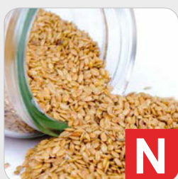
Sesam z.B. Brot, Gebäck, Desserts etc.