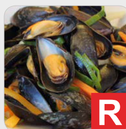
Weichtiere z.B. Schnecken, Muscheln und Tintenfische in Suppen, Soßen, Salaten etc.