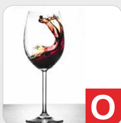
Schwefeloxid und Sulfite z.B. Trockenfrüchte, Kartoffelge- richte, Fruchtsäfte, Marmelade, Wein, Soßen etc.