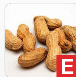
Erdnüsse z.B. Brot, Kuchen, Desserts, Knabberereien, Süßigkeiten etc.