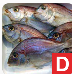
Fisch z.B. Suppen, Würste, Salate, Brotaufstriche, Soßen etc.