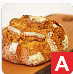
Glutenhaltiges Getreide z.B. Weizen, Roggen, Gerste, Dinkel unter anderem in Brot, Kuchen, Teigwaren, Mehl, Wurstwaren, Desserts etc.

Stoffe oder Erzeugnisse aus diesen Stoffen, die Allergien oder Unverträglichkeiten auslösen können