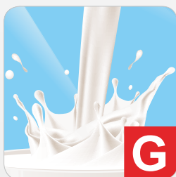
Milch (inkl. Laktose) z.B. Brot, Gebäck, Pommes Frites, Kuchen, Desserts, Würste, etc.