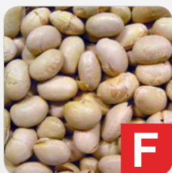
Sojabohnen z.B. Brot, Kuchen, Desserts, Milchersatz, Brotaufstriche, Salate etc.