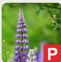
Lupinen z.B. Desserts, Gebäck, Brot, Gewürzmischungen etc.