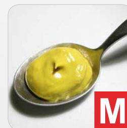
Senf z.B. Soßen, Mayonaisse, Gewürzmischungen, Suppen etc.