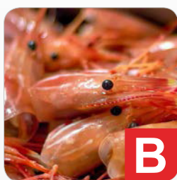
Krebstiere z.B. Brötchen, Salate, Soßen etc.