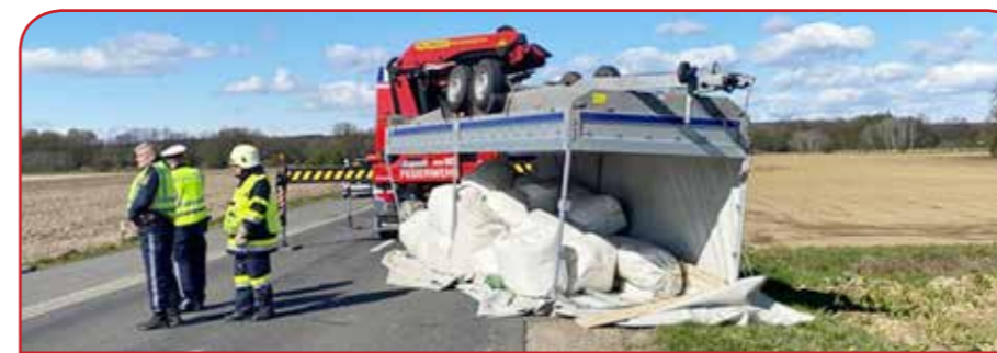
VU in Gosdorf mit einem Transportanhänger