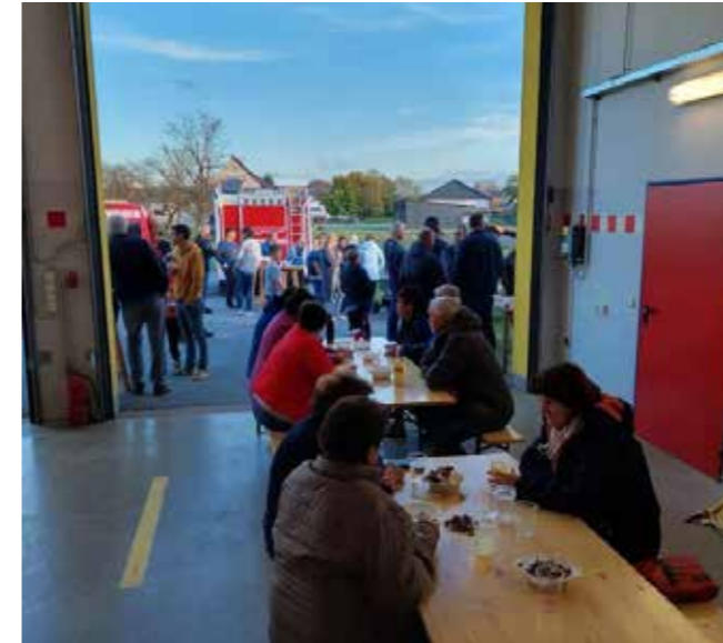
An einem herrlichen Herbstnachmittag lud die Feuerwehr zum gemeinsamen Kastanienbraten vor dem Rüsthaus ein.