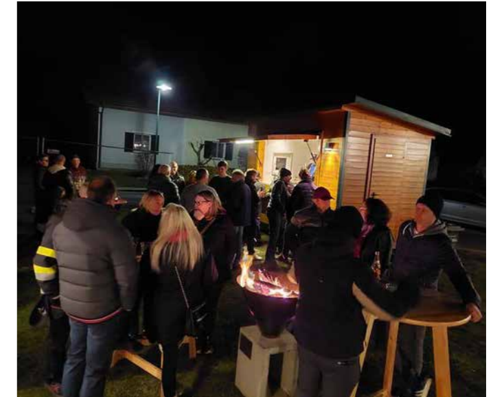
Das traditionelle dreitägige Osterlicht ist zum Treffpunkt von Jung und Alt aus der gesamten Region geworden.