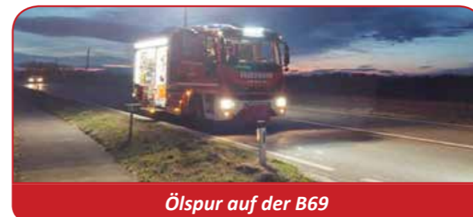
Ölspur auf der B69