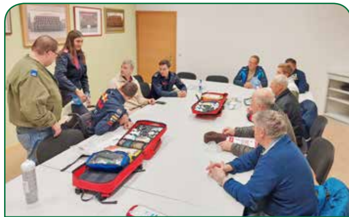
Sanitätsübung mit neuen SAN-Rucksack