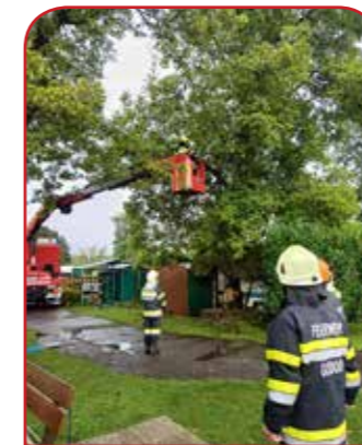
Sturm in Mureck Juli, keine Schäden in Gosdorf