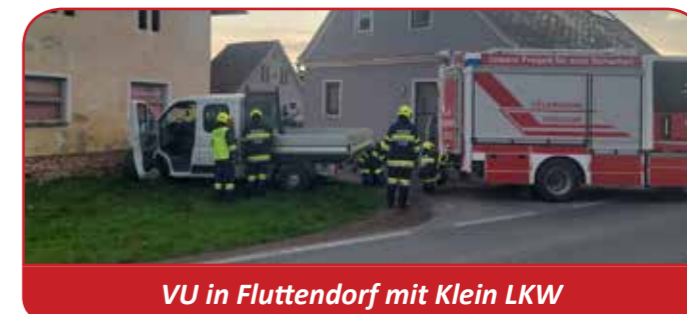
VU in Fluttendorf mit Klein LKW