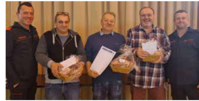
Ein neuer Rekord 110 Schnapsler und Schnapslerinnen, haben beim Feuerwehr-Schnapsen der FF Gosdorf teilgenommen. So konnten über 90 gesponserte Fleischkörbe für unsere Schnapsler organisiert werden.