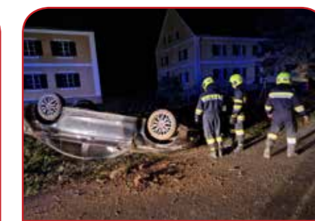
VU in Helfbrunn