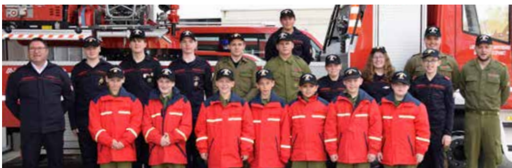
„Einer für alle – alle für einen“ war das Motto der Feuerwehrjugend Gosdorf beim Wissenstest 2023 in Bad Radkersburg.