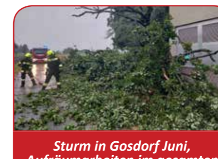
Sturm in Gosdorf Juni, Aufräumarbeiten im gesamten Löschbereich Gosdorf