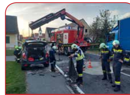
VU in Diepersdorf LKW mit PKW