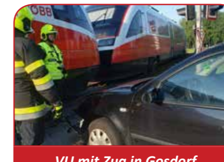
VU mit Zug in Gosdorf beim GH Reisacher