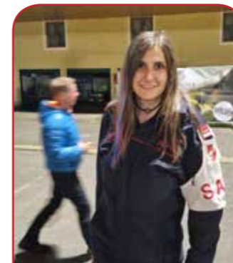
Einsatz als Sanität beim BFT