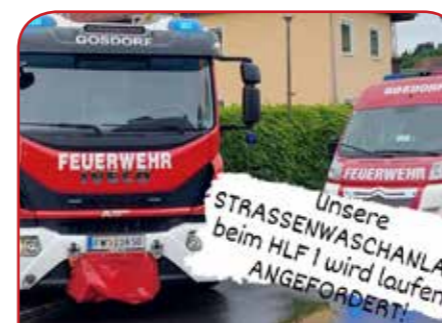
Hochwassereinsatz Mureck Juli