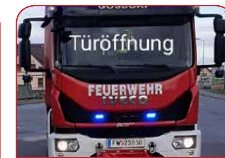
Türöffnung in Gosdorf