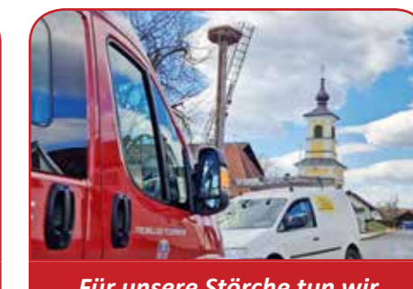
Für unsere Störche tun wir ALLES!